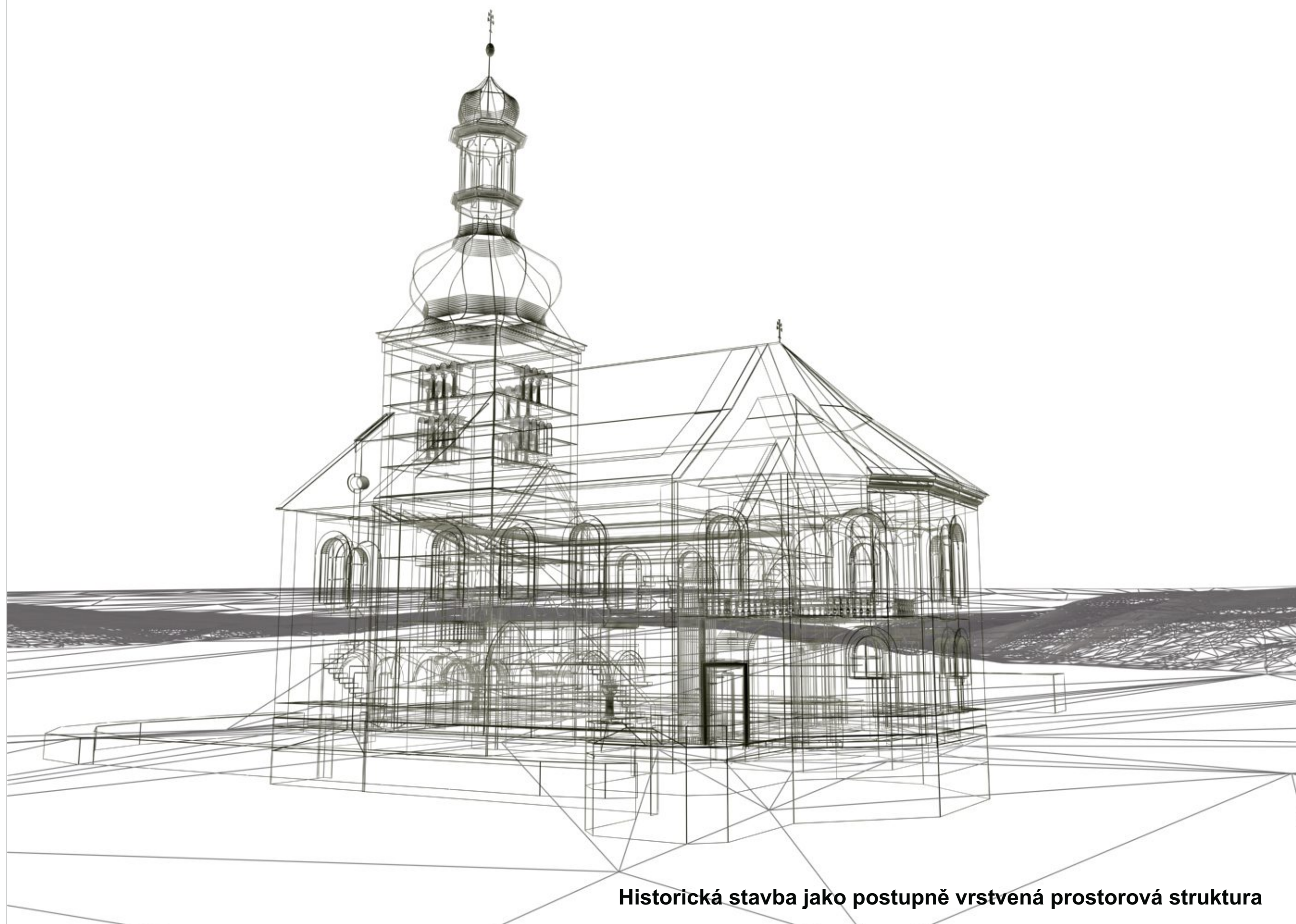
Historická stavba jako postupně vrstvená prostorová struktura